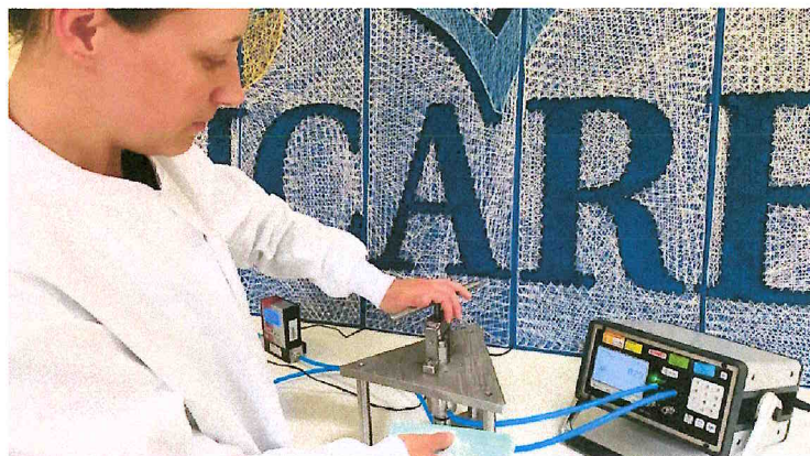
les masques sont testés en laboratoire

Spécialisé dans la sécurité des dispositifs médicaux et la contamination, le groupe Icare, basé sur le Biopôle Clermont-Limagne à Saint-Beauzire dans le Puy-de-Dôme, vient de développer des tests permettant de mesurer l'efficacité des trois types de masques que l'on trouve désormais sur le marché.